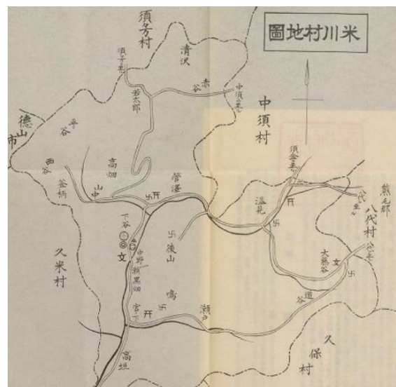
図3. 旧米川村地図 都濃郡米川村誌(1938)より

明治期には米川地区を含む現在の下松市域は都濃郡の一部であった。都濃郡の郡域は、明治初年時には50村（47村3島）で構成されており、この中で現在の米川地区に当たるのは「下谷村」、「瀬戸村」、「温見村」、「大藤谷村」の4か村である。1874年の大区小区制や1878年の郡区町村編成法を経た後の、1889年4月1日の町村制の施行により、下谷村・瀬戸村・温見村・大藤谷村の区域をもって「米川村」が発足した。米川村の県庁による名称の原案は「戸見谷村」であったが、下谷村外三カ村は協議の結果、「米川村」と答申し決定された。1954年には下松市に編入されたが、「米川」の名称は字名として使用されている。「米」の名を冠することからもわかる通り、本地域の名産の一つに「米川米」があり、特産品を考える上でのヒントとなった。