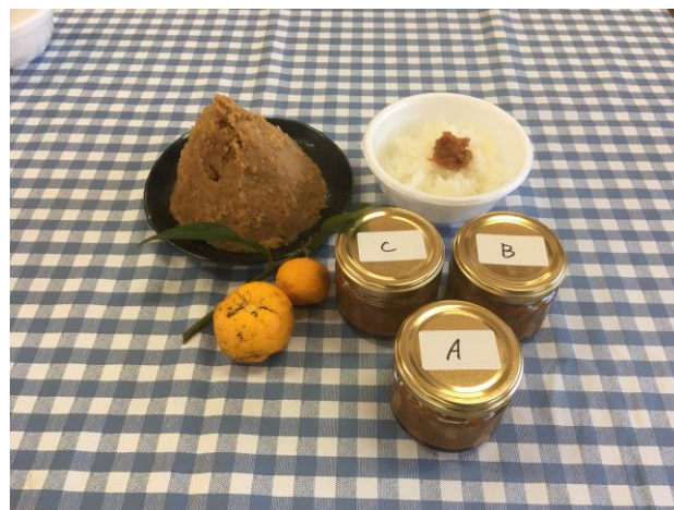
写真4. ゆずみそ制作発表会で出された試作品

両ゼミの活動後、下松商業開発株式会社により調査分析が継続され、下松市の花岡地区で戦後「ゆずみそ」が製作され、販売されていた時期があったことが判明した。また、同様に特産品である「米川米」に合う商品ということで、最終的に「ゆずみそ」を商品化することが決定し、下松市により2019年3月9日「ゆずみその制作発表会」が実施され、試食会が行われた。A（復刻版）、B・C（A+ゆずジャム※Cの方が果汁の割合が少ない）の食べ比べが行われ、20代はBを好み30代はAを好む傾向があることが分かった。回答者は男性が多かったため、今後は女性へのマーケティングが必要である。