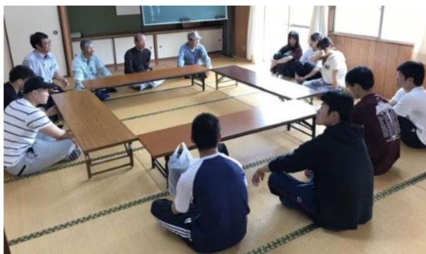
写真2. 米川公民館での話し合いの様子

2018年夏季休業中、年山口県の「中山間地域振興特別対策事業補助金」を受けた下松市企画財政課から徳山大学に特産品を利用した商品づくりのアイデア出しの依頼があった。夏季休業中には学生によるまちづくり団体「がくまち」のメンバーも加わり、話し合いを継続した。