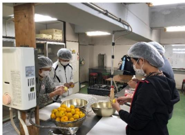
写真3. ゆずみそ作り体験