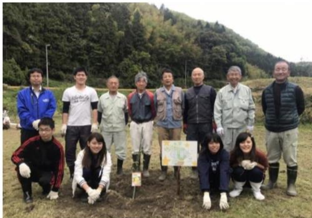
写真1. 耕作放棄地を活用したゆず農園

2018年度前期寺田ゼミでは、米川ゆずの会の指導のもと耕作放棄地へのゆずの植樹、他の作物の植え付けを行った。その後、ゆずや他の作物の世話、ゆず等を用いた特産品試作を行った。自主的に畑に世話に行き、収穫物や代替物（ゆずはまだ時期ではなかった）を用いた試作品づくりが行われた。